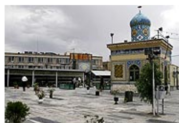
قبرستان شیخان قم

شیخان قبرستانی کوچک شاید به اندازه یک زمین بسکتبال است که دور تا دور آن عکس شهدا جای گرفته و در وسط آن بسیاری از روحانیان سرشناس دفن شده‌اند.